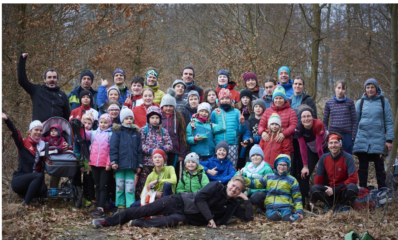
Fotka: účastníci VT Brno