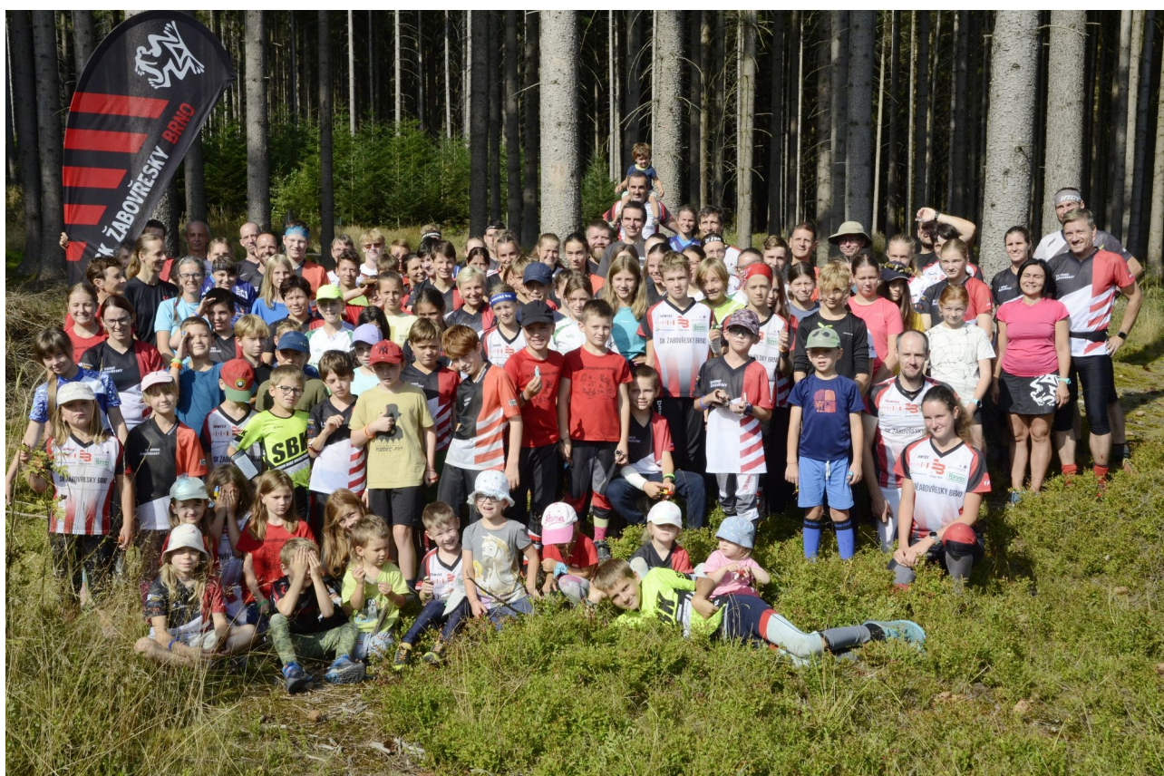
Fotka: účastníci orientáckého tábora

S podnadpisem: Vzpomínky na jarní a letní dny